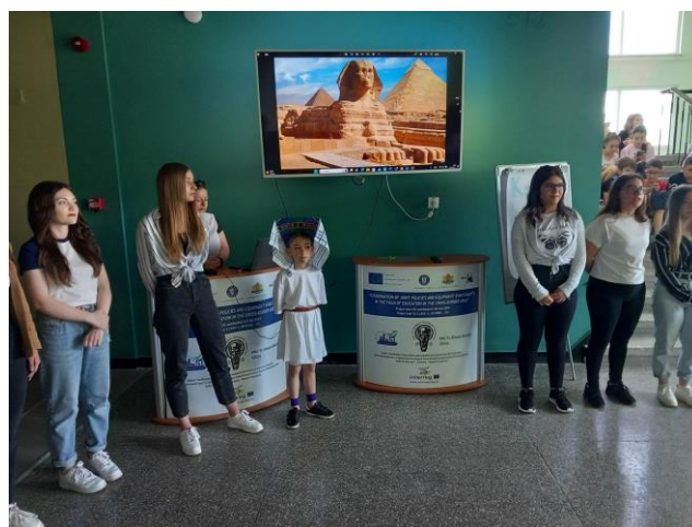
Представяне на ПБО по интерактивен начин на тема „Мегалитни конструкции, барелефи, мистика и история“. Това е интегриран урок между история и биология за чиято подготовка се проведе учебна екскурзия до Глиска и Шумен..