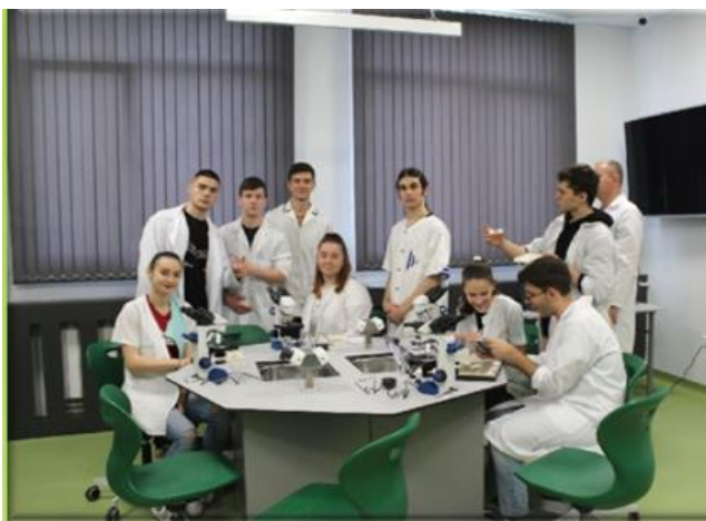
Изпълнение на практическа задача - определяне на биологични обекти – тъкани при растения и животни, едноклетъчни организми на трайни микроскопски препарати.

Реномираната материална база създава оптимални условия за висока успеваемост на нас гимназистите. За поредна учебна година ПМГ „Св. Климент Охридски“ се откроя с отличните резултати на учениците от национални олимпиади (математика, БЕЛ, английски език, лингвистика, Microsoft), конкурси и състезания (Математика без граници, дигитални компетентности, лингвистика, есенни турнири по математика, спорт – волейбол, баскетбол, футбол, шах ), както и участия в международни олимпиади и състезания (олимпиада по математика – Норвегия, международен турнир „Математика без граници“, Балканска олимпиада по математика – Анталия, MOS World Championship в САЩ). Много са успехите на нашите гимназисти и в различните сфери на изкуствата – театрално майсторство, изобразително изкуство, литературно творчество и музика.